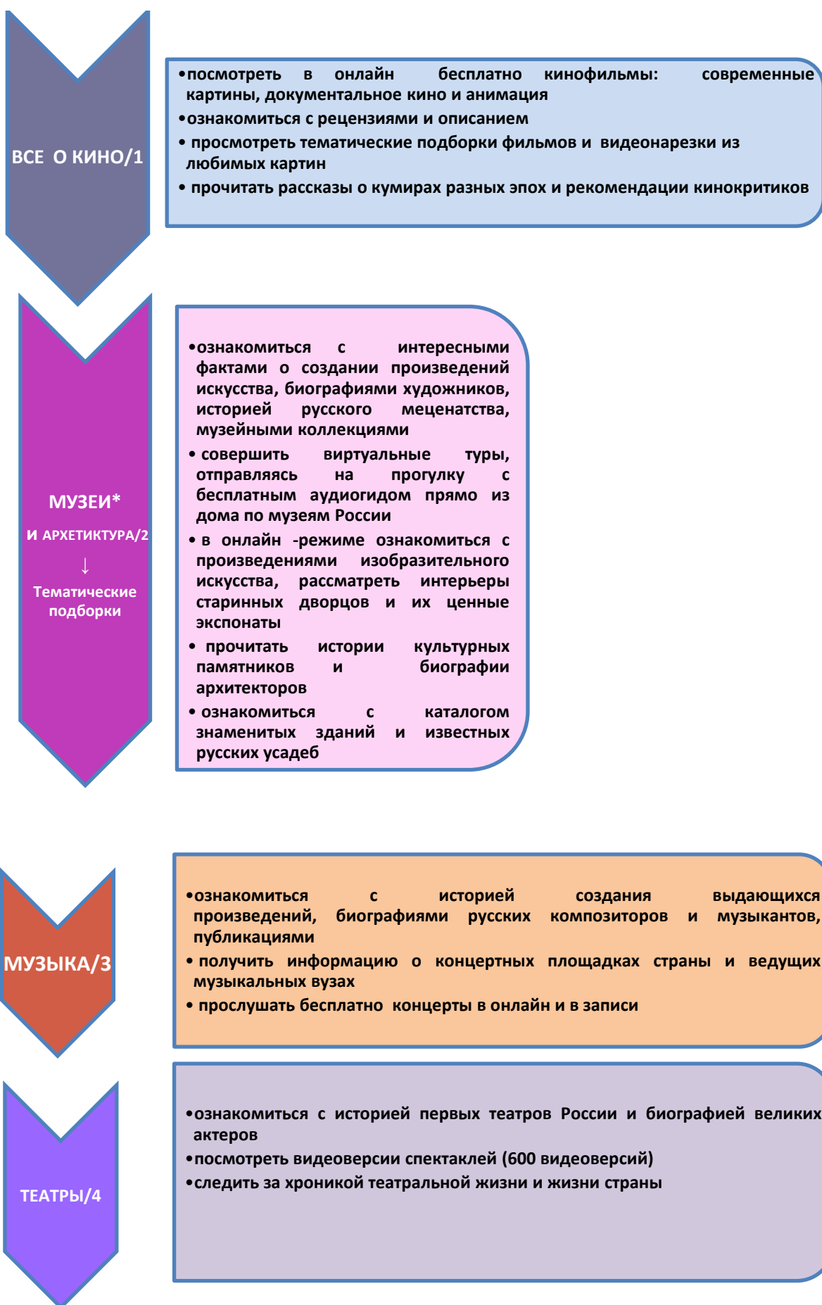
Рисунок 2. Блок – схема кнопок «Культура и искусство»