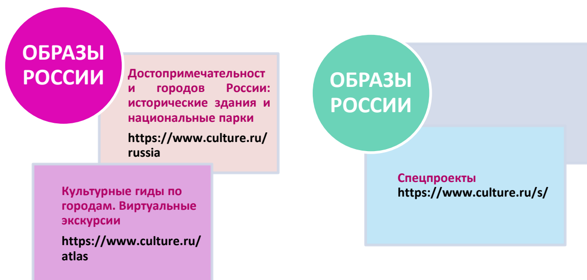
Рисунок 6.Схема блок-кнопок «Образы России»