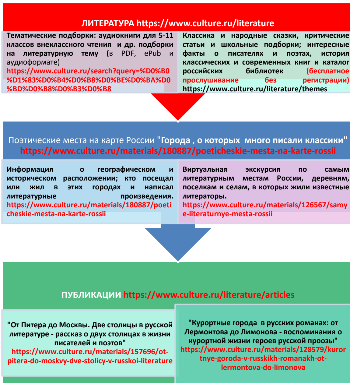
Рисунок 3. Блок схема кнопок «Языковая адаптация»